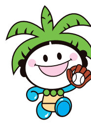
女子ソフトボール