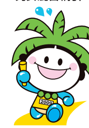
マスターズ陸上競技