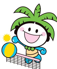
ソフトバレーボール