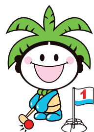
グラウンド・ゴルフ