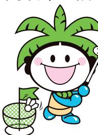
ターゲット・バードゴルフ