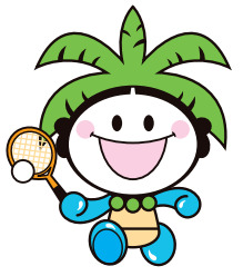
年齢別ソフトテニス