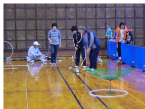
ターゲットバードゴルフ