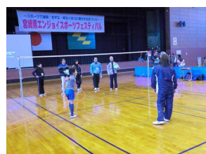
ビーチボールバレー