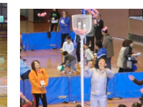
玉入れ(中央に知事も)